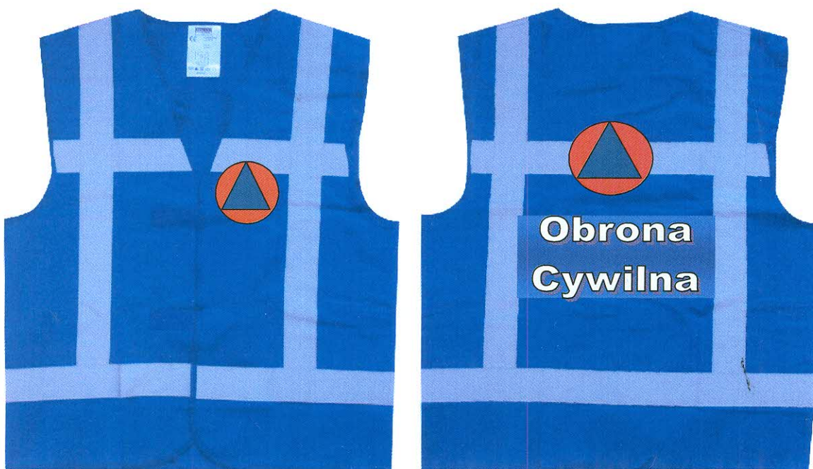
Rys. Umieszczenie międzynarodowego znaku obrony cywilnej na umundurowaniu członków formacji obrony cywilnej oraz ubiorze organów i personelu obrony cywilnej.