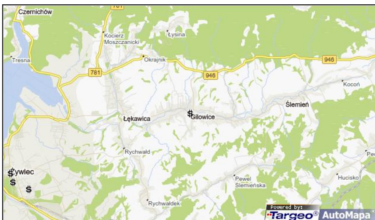
Mapa nr 1: Lokalizacja Gminy Gilowice w jej najbliższym otoczeniu

Lokalizację Gminy Gilowice zaprezentowano na poniższych mapach: