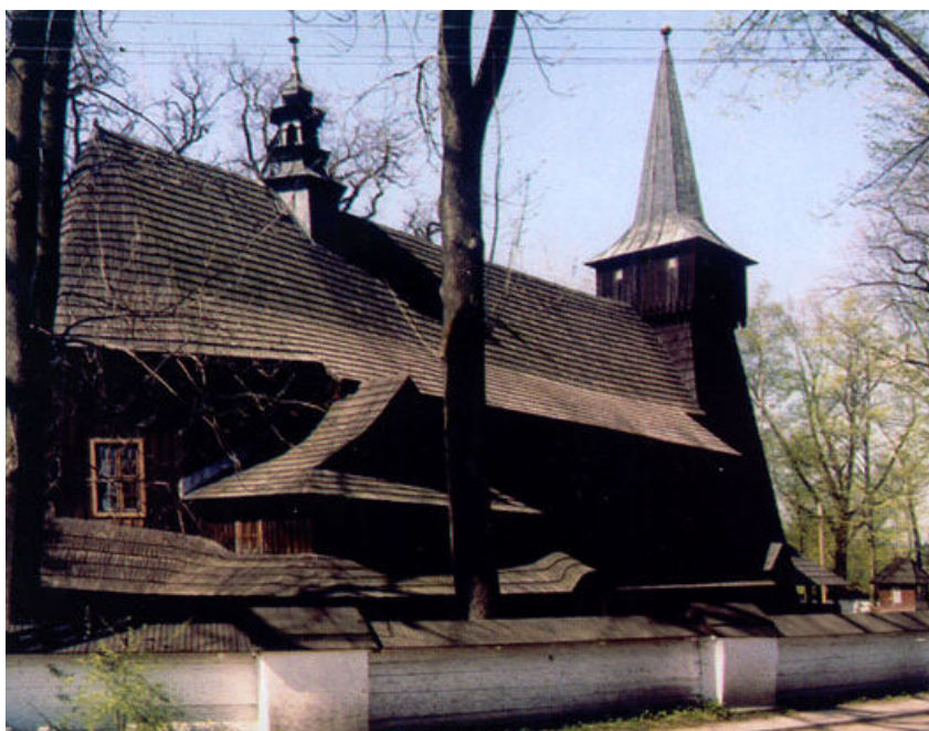
Zdjęcie 1 Gilowice – Kościół Św. Andrzeja Apostoła

Parafia Św. Andrzeja Apostoła, została erygowana w 1925 r. Budynek Kościoła to najstarszy w centrum wsi obiekt, jego pochodzenie datowane jest na I połowę XVI wieku. Drewniany Kościół powstał w stylu śląsko – małopolskim, kryty jest gontem i ogrodzony drewnianym płotem. Należy do klasy zabytków ZERO. Wewnątrz mieści się późnobarokowy ołtarz, ambona i pacyfikał z XVII wieku, oraz XIV wieczny posąg Matki Boskiej. Przed sobotami stawiany jest najstarszy zabytek kościoła – kamienna chrzcielnica o wysokości 102 cm. Kościół jest pod stałą troską plebanii, parafian i miejscowych władz gminnych. Obok Kościoła mieści się stary cmentarz i pomnik poświęcony poległym Gilowiczanom w czasie I Wojny Światowej.